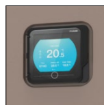
Écran tactile LED